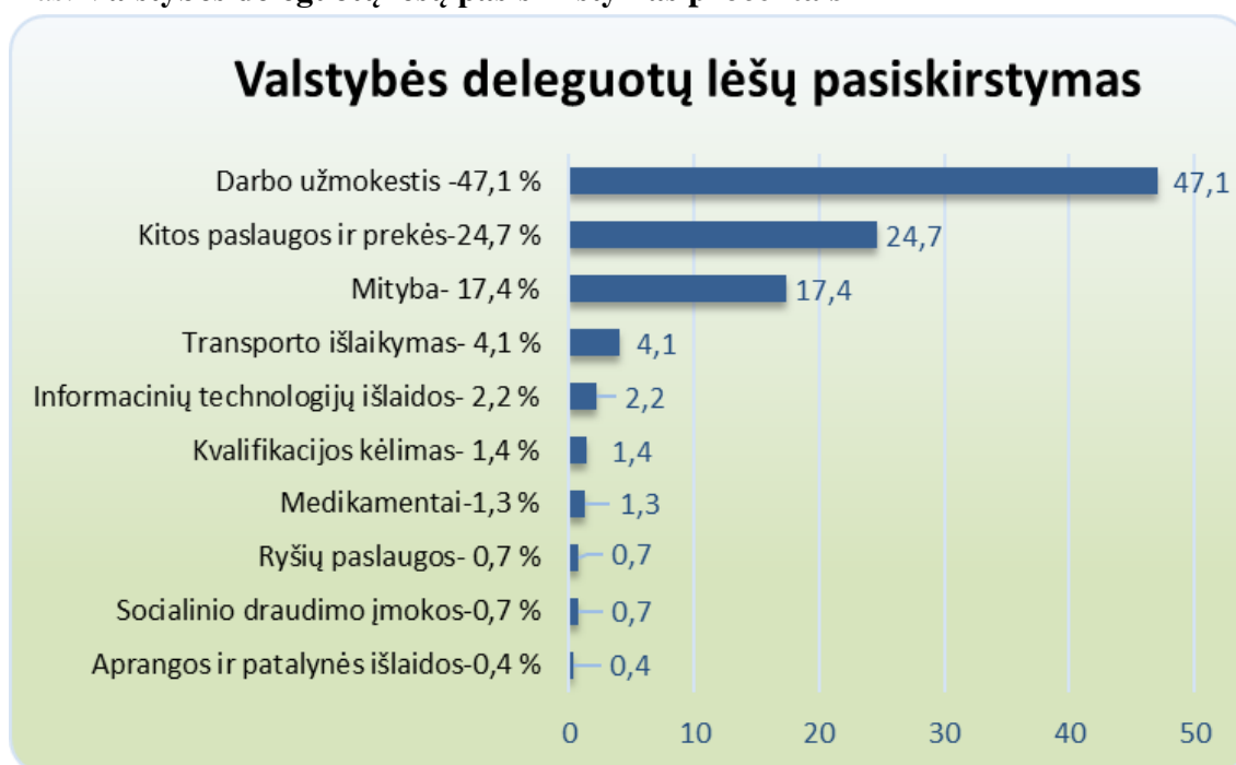
3 grafikas. Valstybės deleguotų lėšų pasiskirstymas procentais

Valstybės deleguotos lėšos pasiskirstė: darbuotojų dirbančių su sunkia negalia asmenimis darbo užmokestis – 10 813,80 Eur, socialinio draudimo įmokos – 156,70 Eur, medikamentams 291,38 Eur, mitybos išlaidos – 3 999,48 Eur, ryšių paslaugos – 165,29 Eur, transporto išlaidos – 943,12 Eur, aprangos ir patalynės išlaidos – 90,00 Eur, kvalifikacijos kėlimas – 320,00 Eur, informacinių technologijų išlaidos – 500,00 Eur, kitos paslaugos ir prekės – 5652,73 Eur.