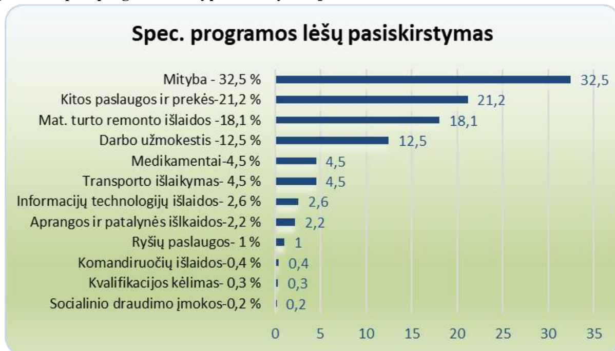
4 grafikas. Spec. programos lėšų pasiskirstymas procentais

Gautos lėšos už teikiamas paslaugas įstaigoje pasiskirsto taip: darbo užmokesčiui – 6451,79 Eur, socialinio draudimo įmokoms – 90,25 Eur, mitybai – 16 846,43 Eur, medikamentams – 2319,74 Eur, ryšių paslaugos – 509,37 Eur, transporto išlaikymui – 2315,93 Eur, aprangai ir patalynėi – 1132,93 Eur, komandiruočių – 235,89 Eur, mat. turto remonto išlaidoms – 9401,02 Eur, kvalifikacijos kėlimas – 178,00 Eur, informacijų technologijų išlaidos – 1337,02 Eur, kitoms prekėms ir paslaugoms – 10 976,56 Eur.