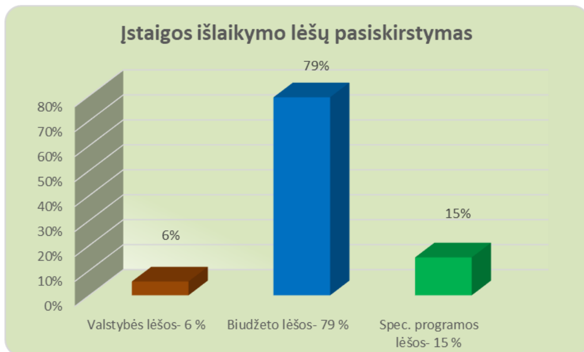
1 grafikas. Įstaigos išlaikymo lėšų pasiskirstymas

Kaip matyti pirmame grafike, 2020 metais įstaigos išlaikymo lėšas sudarė: biudžeto lėšos – 79 % , valstybės lėšos – 6 % , spec. programos lėšos – 15 %.