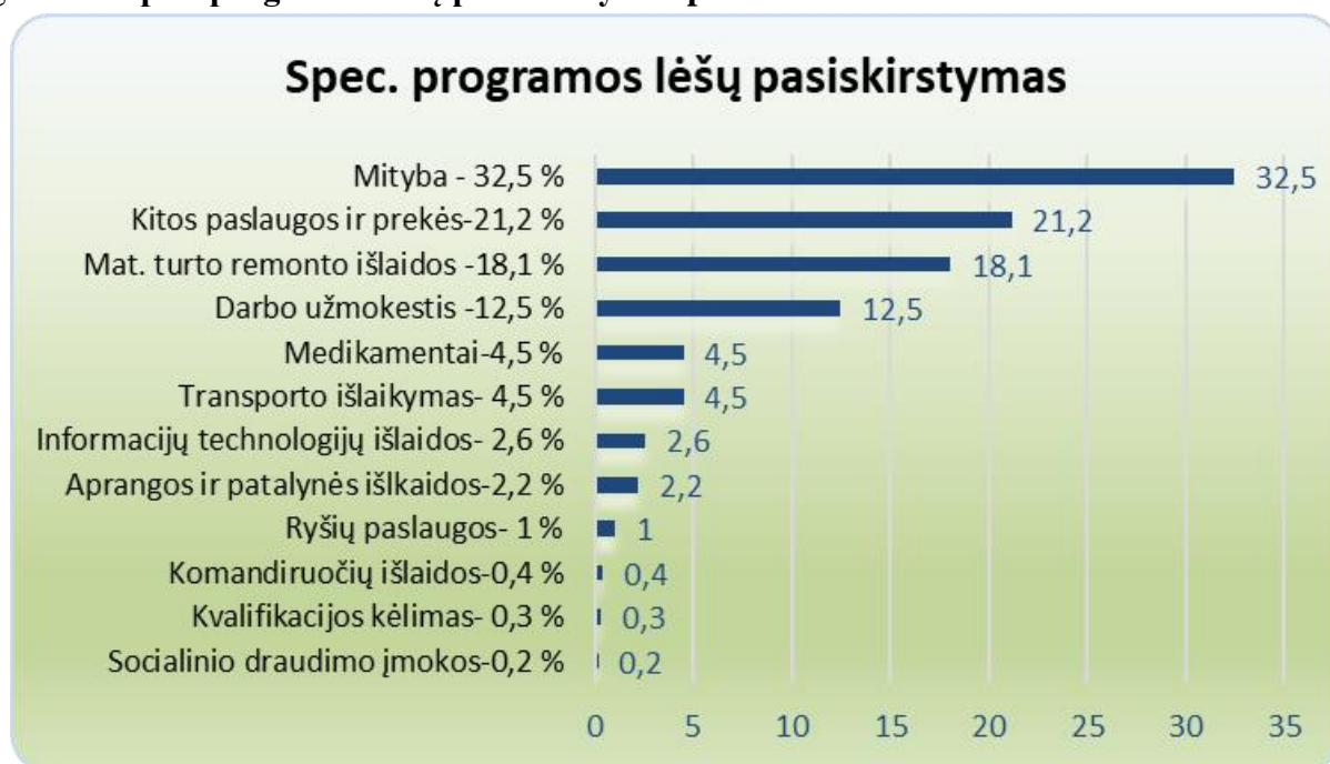
4 grafikas. Spec. programos lėšų pasiskirstymas procentais

Gautos lėšos už teikiamas paslaugas įstaigoje pasiskirsto taip: darbo užmokesčiui – 6451,79 Eur, socialinio draudimo įmokoms – 90,25 Eur, mitybai – 16 846,43 Eur, medikamentams – 2319,74 Eur, ryšių paslaugos – 509,37 Eur, transporto išlaikymui – 2315,93 Eur, aprangai ir patalynėi – 1132,93 Eur, komandiruočių – 235,89 Eur, mat. turto remonto išlaidoms – 9401,02 Eur, kvalifikacijos kėlimas – 178,00 Eur, informacijų technologijų išlaidos – 1337,02 Eur, kitoms prekėms ir paslaugoms – 10 976,56 Eur.