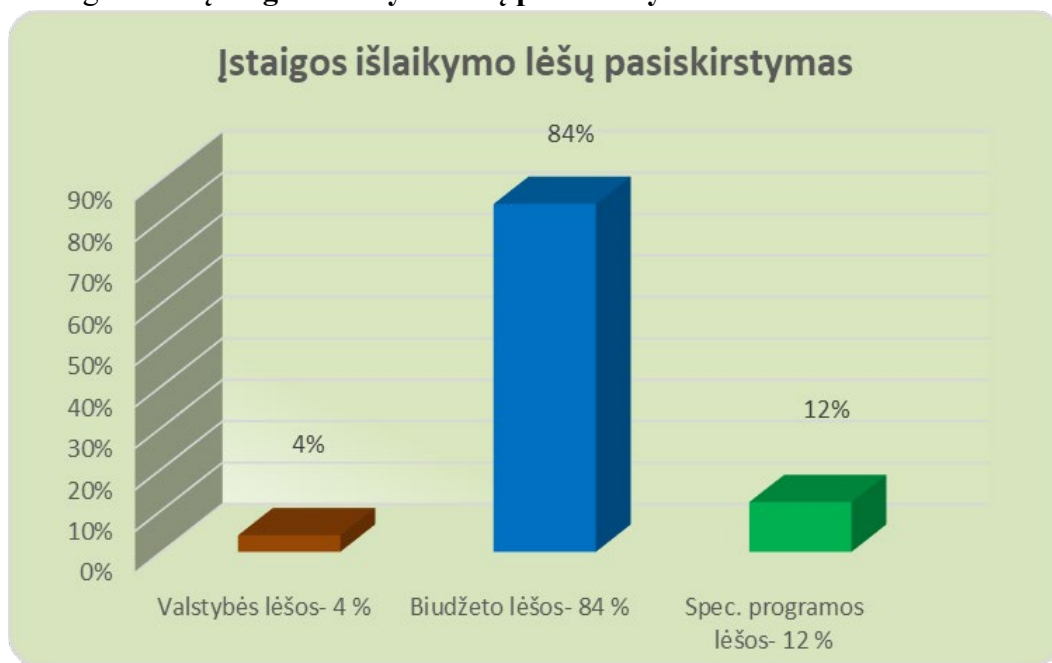
1 grafikas. Įstaigos išlaikymo lėšų pasiskirstymas

Kaip matyti pirmame grafike, 2021 metais įstaigos išlaikymo lėšas daugiausiai sudarė biudžeto lėšos – 84 %. Kiti šaltiniai – spec. programos lėšos (12 %) ir valstybės lėšos (4 %).