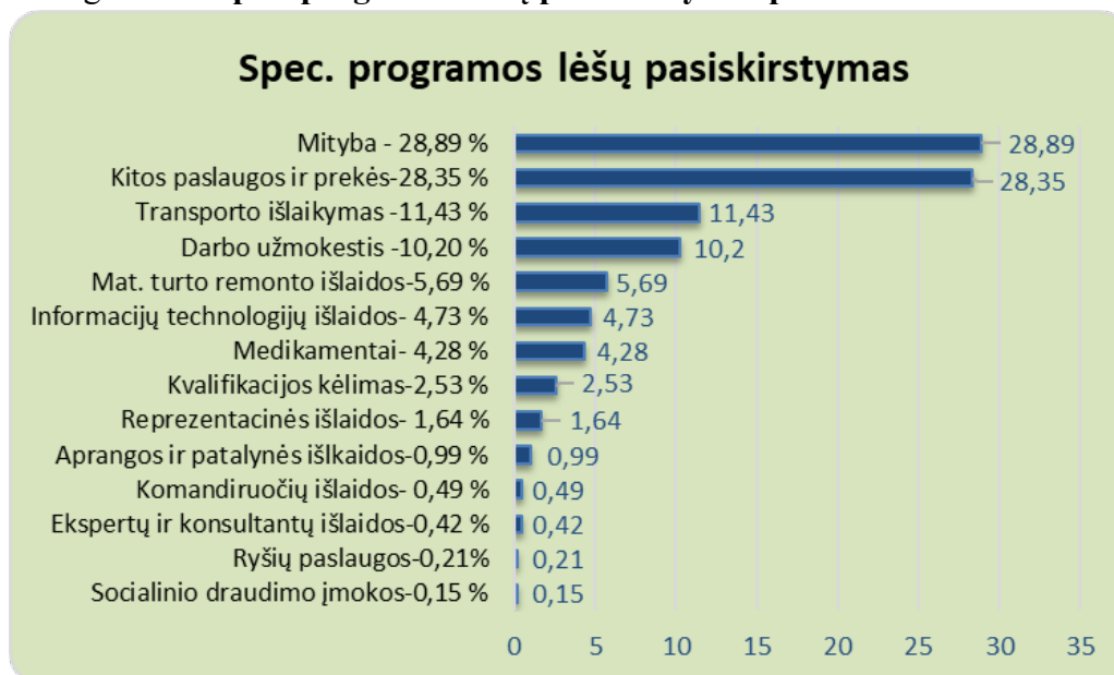
4 grafikas. Spec. programos lėšų pasiskirstymas procentais

Kaip matyti 3 grafike, pusė valstybės deleguotų lėšų skirtos darbuotojų, dirbančių su asmenimis su sunkia negalia, darbo užmokesčiui – 9 652,04 Eur. Kitos valstybės deleguotos lėšos pasiskirstė taip: socialinio draudimo įmokos ir darbdavio soc. parama – 288,96 Eur, medikamentams 268,85 Eur, mitybos išlaidos – 3 701,54 Eur, ryšių paslaugos – 171,31 Eur, transporto išlaikymas – 1 140,84 Eur, mat. turto remonto išlaidos – 958,89 Eur, kvalifikacijos kėlimas – 150,79 Eur, informacinių technologijų išlaidos – 354,53 Eur, kitos paslaugos ir prekės – 2297,25 Eur.