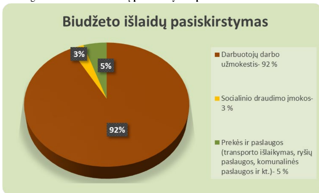
2 grafikas. Biudžeto išlaidų pasiskirstymas procentais

Kaip matyti pirmame grafike, 2021 metais įstaigos išlaikymo lėšas daugiausiai sudarė biudžeto lėšos – 84 %. Kiti šaltiniai – spec. programos lėšos (12 %) ir valstybės lėšos (4 %).